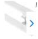
Puxador Porta 40cm Alumínio - Decorpla

de R$10,90 por R$10,90 à vista ou R$ 10,00 1x de R$ 10,00 sem juros