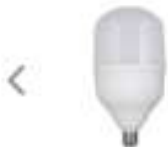
Lâmpada Led Bulbo 50W E27 Bivolt Branca ...

por R$ 121,50 à vista ou R$ 135,00 3x de R$ 45,00 sem juros