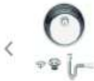
Cuba Redonda Tramontina Polido 30x14

de R$205,00 por R$169,00 à vista ou R$ 188,00 3x de R$ 58,33 sem juros